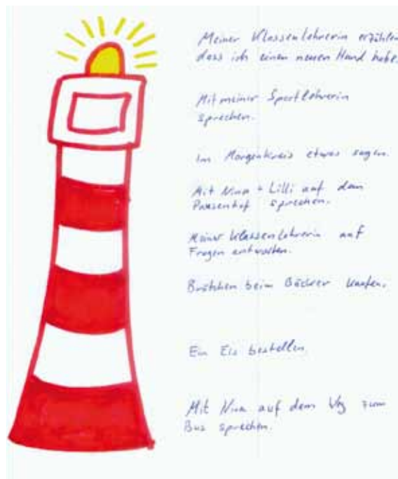
■ Abb. 3: Leuchtturm-Methode zur Hierarchisierung individueller Ziele (unten leichte, dann zunehmend anspruchsvollere Ziele)