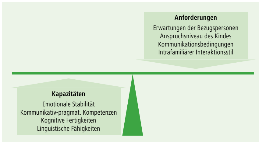
■ Abb. 2: Anforderung- und Kapazitätsmodell nach Starkweather et al. (1990)

zu sein. Gegenübergestellt gibt es den anderen Pol, das Schweigen, das „Nicht-Handeln-Können“ in bestimmten Situationen. Zwischen diesen beiden Polen bzw. zwischen diesen beiden Welten gibt es Zwischenräume – verschiedene Verhaltensweisen – die dem Kind jedoch noch nicht ausreichend zur Verfügung stehen.